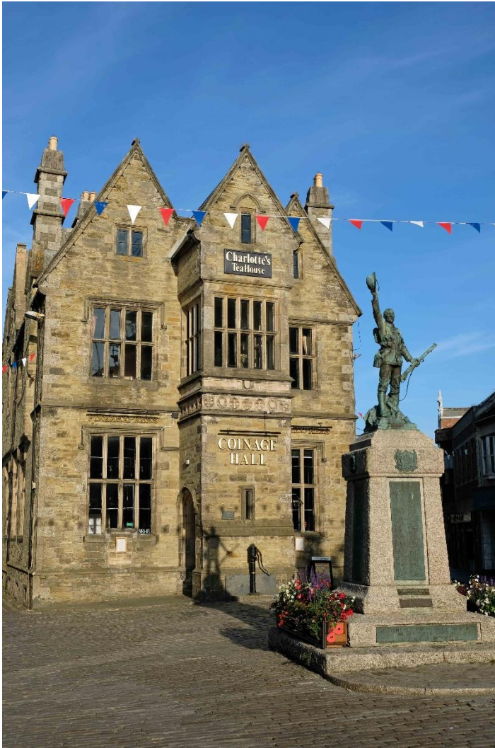
Charlotte's Victorian Tea House