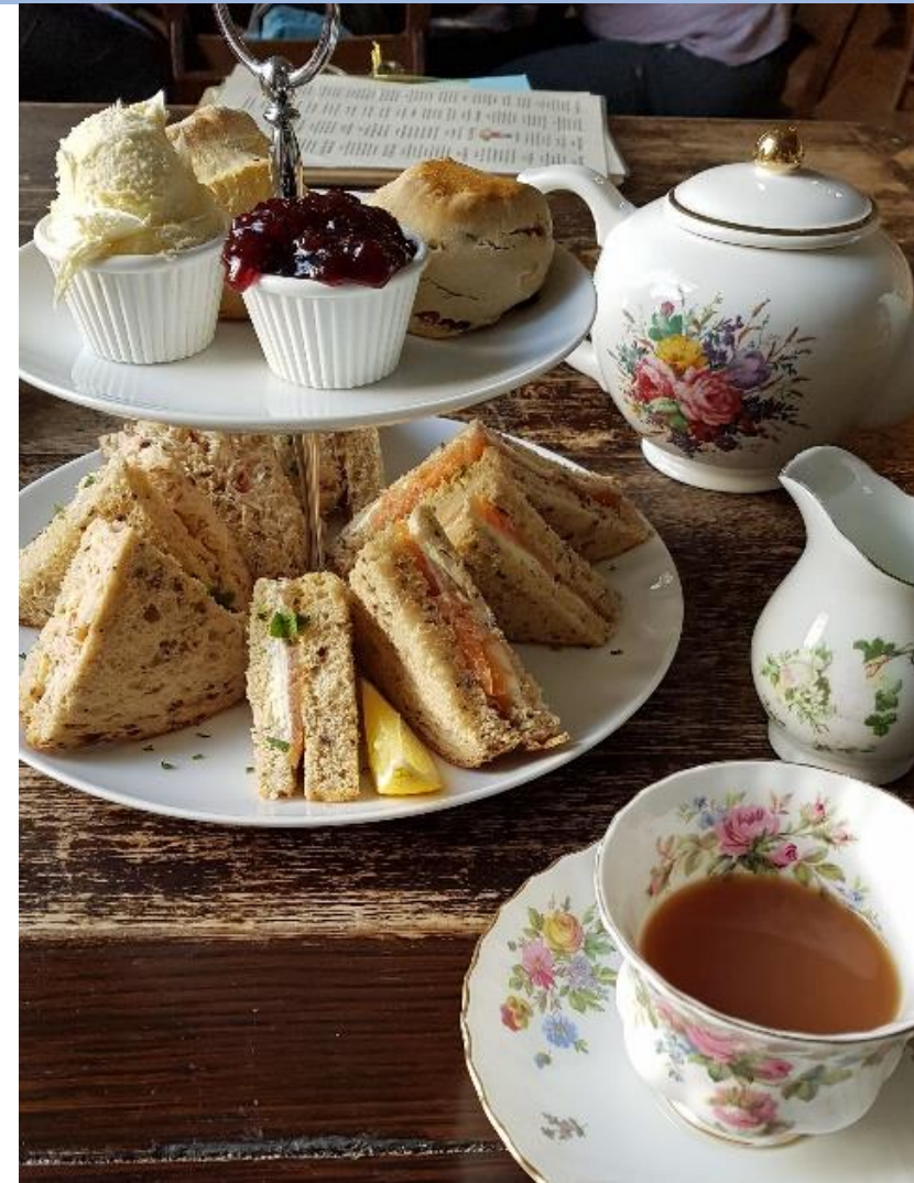
Scones, Krabben- & Lachs-Sandwiches