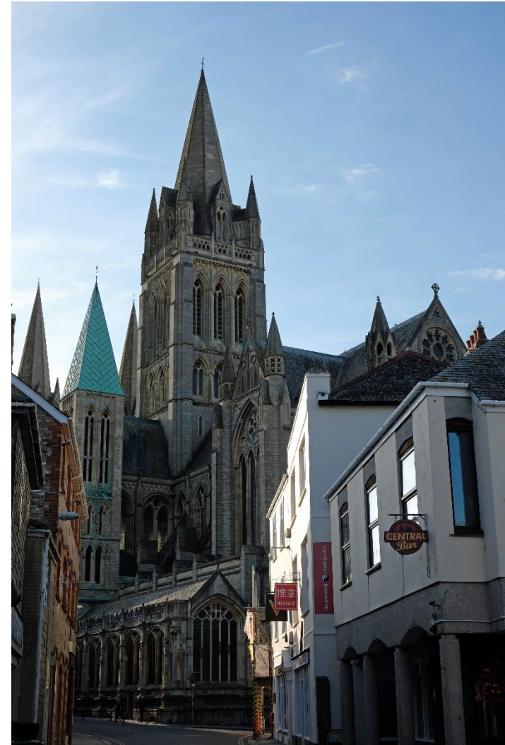
Viktorianische Kathedrale mit gotischen Türmen