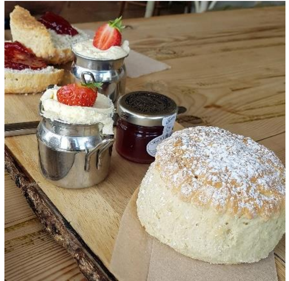
Scones mit Clotted Cream & Erdbeermarmelade